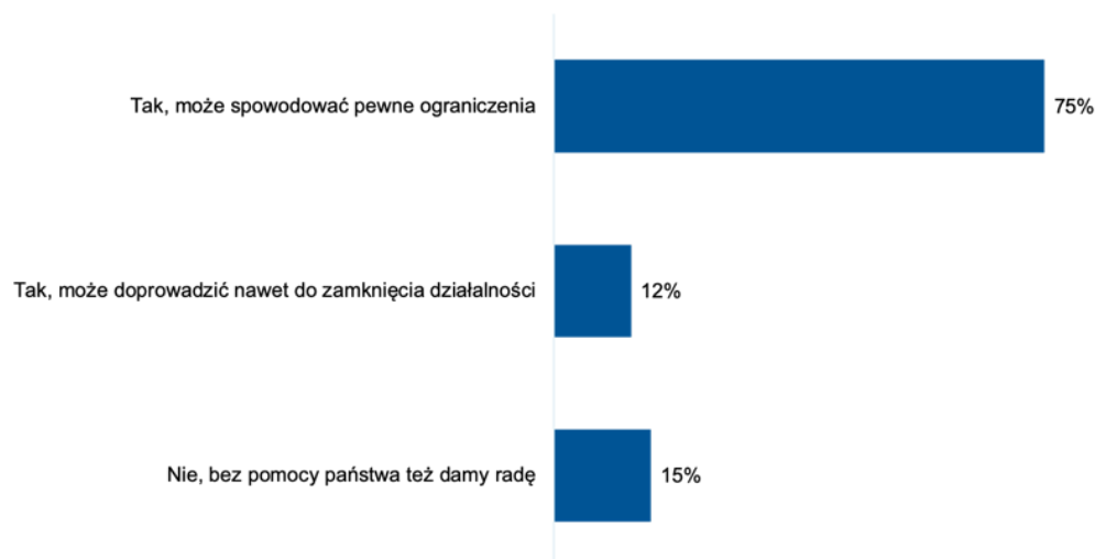
Czy niewystarczająca pomoc ze strony państwa może spowodować decyzję o ograniczeniu działalności Twojej firmy?

- Warto podkreślić, że badanie Polskiego Związku Przemysłu Kosmetycznego diagnozuje pierwszy miesiąc problemów, które mogą być jeszcze przed nami. Dlatego trzeba wyciągać wnioski z opinii firm, uruchomić rozwiązania na które biznes zwraca uwagę i przede wszystkim skutecznie odmrażać gospodarkę. Aby w kolejnych miesiącach sytuacja mogła być określona jako w miarę stabilna przy wszystkich trudnościach biznes musi mieć dostęp do instrumentów wsparcia, zwłaszcza, że większość analiz mówi o możliwym kolejnym uderzeniu pandemii późną jesienią – dodaje Blanka Chmurzyńska-Brown.